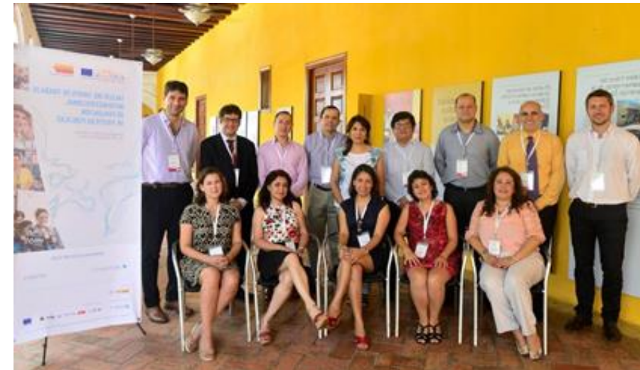
Regional Workshop in Cartagena de Indias, Colombia 2013