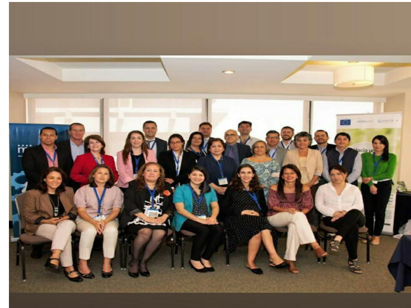
Towards a Regional Agenda of Evaluation, Workshop San José de Costa Rica, July 2017